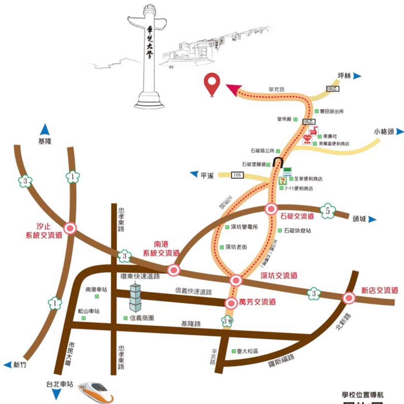
■ 華梵大學交通路線圖